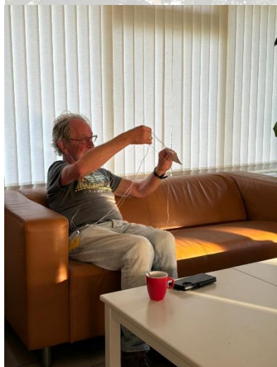
Maik ontwart breiwool