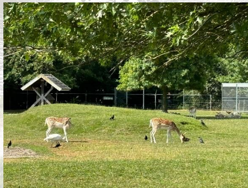
Het park met waterval en herten